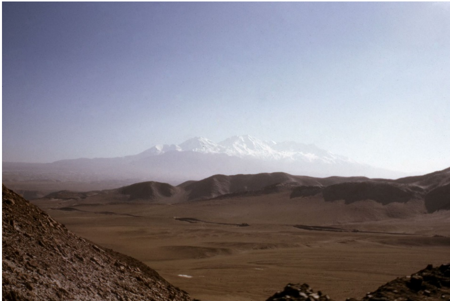
Joëlle de la Casinière, Again on the Seas , 2015.

Voor de derde en laatste tentoonstelling die de dialectiek tussen fotografisch en bewegend beeld in de Argos-collectie onderzoekt, kijken we naar straten, hinterlanden en landschappen. Zoals de oudste overlevende camerafoto, View from the Window at Le Gras (1826-1827) van Nicéphore Niépce (1765-1833), openen de werken in de tentoonstelling het perspectief op stedelijke en landelijke omgevingen. Specifieke plekken zijn soms eindpunten, of plaatsen voor een nieuw begin. Ze vertellen ons iets over dagelijkse reizen langs buurten die enorm veranderd zijn, of ze zijn representaties van ongekende regio's, klaar om ontdekt te worden. Sommige plekken lijken nu eens triviaal, dan weer ontzettend mooi. Ze kunnen een iconisch en universeel herkenbaar aspect in zich dragen, en in sommige gevallen heeft de herinnering aan hun verschijning de tijd niet doorstaan. Voorbij de evidente contrasten, is de relatie tussen natuurlijke landschappen en de gebouwde omgeving veel complexer dan op het eerste gezicht lijkt. Zo toont de expositie hoe we op de natuur reflecteren en hoe we ons verbinden met landschappen, maar ze vraagt zich ook af hoe een specifieke omgeving ons gedrag en onze verbeelding vorm geeft. Een reis door ruimte en tijd, een zwerftocht langs de wazige lijn tussen praktijk en poëzie.